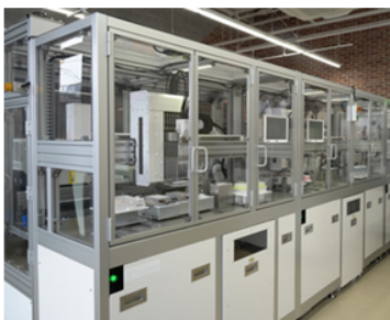
※全自動多検体処理PCR検査装置(所沢lab)